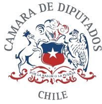
EMILIA SCHNEIDER VIDELA H. DIPUTADA DE LA REPÚBLICA