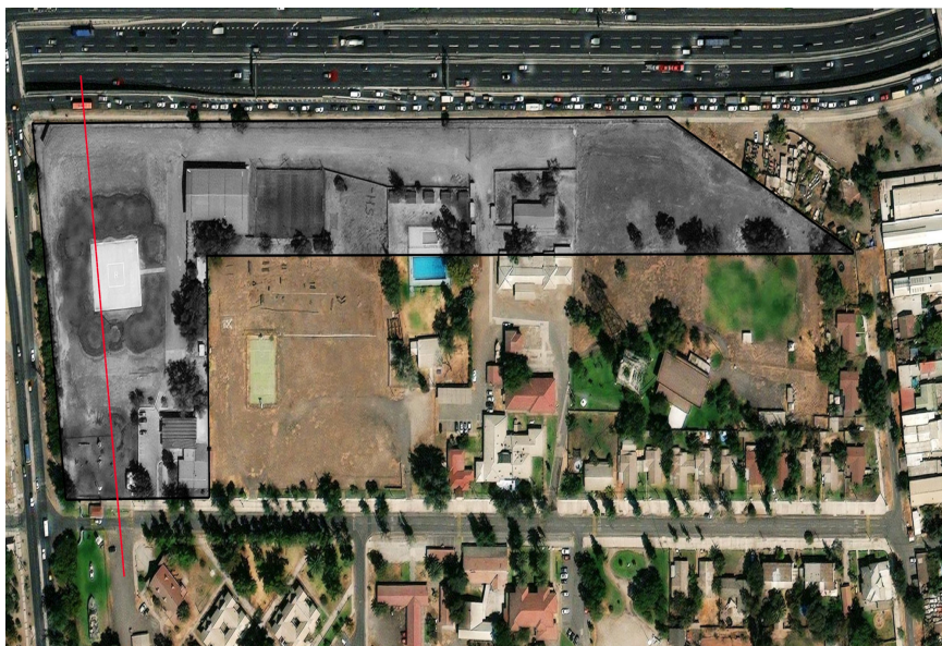
Imagen N°1: Registro actual del inmueble ubicado en Calle Apóstol Santiago N°323, de la comuna de Santiago.