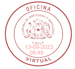
FIRMAO DIGITALMENTE: H.D. CHRISTIAN MATHESON V.