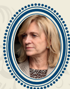
Evelyn Matthei Fornet