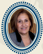
Adriana Muñoz D'Albora