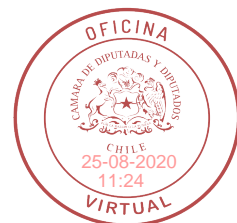
Diego Schalper Sepúlveda H. Diputado de la República

“Cuando de conformidad a los incisos anteriores, se disponga el aumento de uno, dos o tres grados para la determinación de la pena, esta se aumentará siempre en dos o tres grados si hubiere víctimas menores de edad. Si se dispusiere una regla diversa para la determinación de la pena, se aplicará el grado máximo o el máximum de la pena si hubiere víctimas menores de edad”. ”.