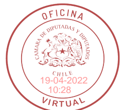
FIRMAO DIGITALMENTE: H.D. KAREN MEDINA V.