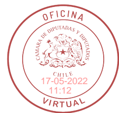
FIRMADO DIGITALMENTE: H.D. LEONARDO SOTO F.