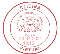
FIRMADO DIGITALMENTE: H.D. CRISTIAN MOREIRA B.