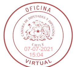
LEONARDO SOTO FERRADA H. DIPUTADO DE LA REPÚBLICA

Artículo 6°: Si una vez construido el monumento quedaran excedentes de las erogaciones recibidas, éstos serán destinados a financiar obras vinculadas a la mantención y cuidado del monumento.