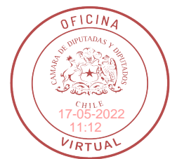
FIRMADO DIGITALMENTE: H.D. LEONARDO SOTO F.