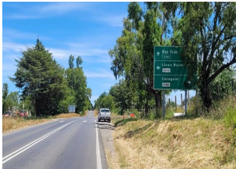
Figura 7: Señalización de locaciones en ruta V-500, dirección Pto. Varas – Río Frío.