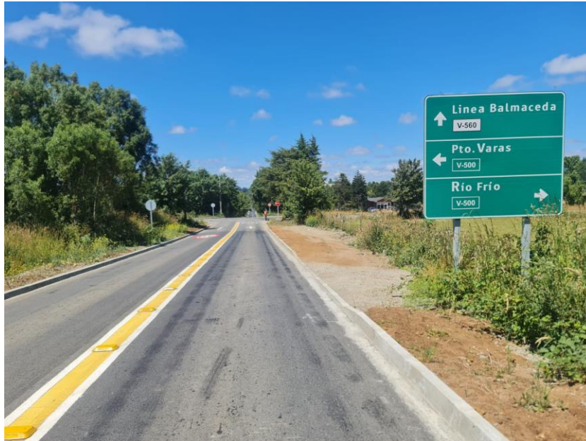
Figura 10: Señal de localidades, dirección Loncotoro – Línea Balmaceda.