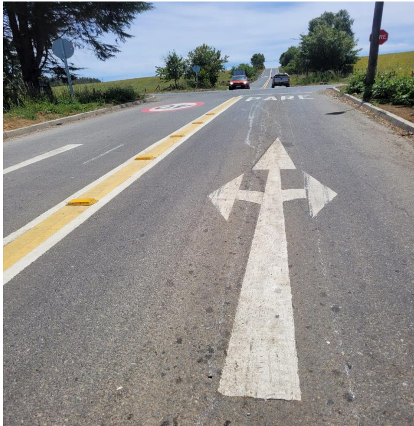
Figura 14: Demarcación de cruce, demarcación de mediana en eje y tachones, Leyenda pare.