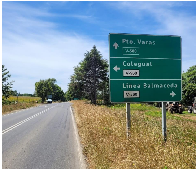
Figura 6: Señalización de locaciones en ruta V-500, dirección Río Frío – Pto. Varas.