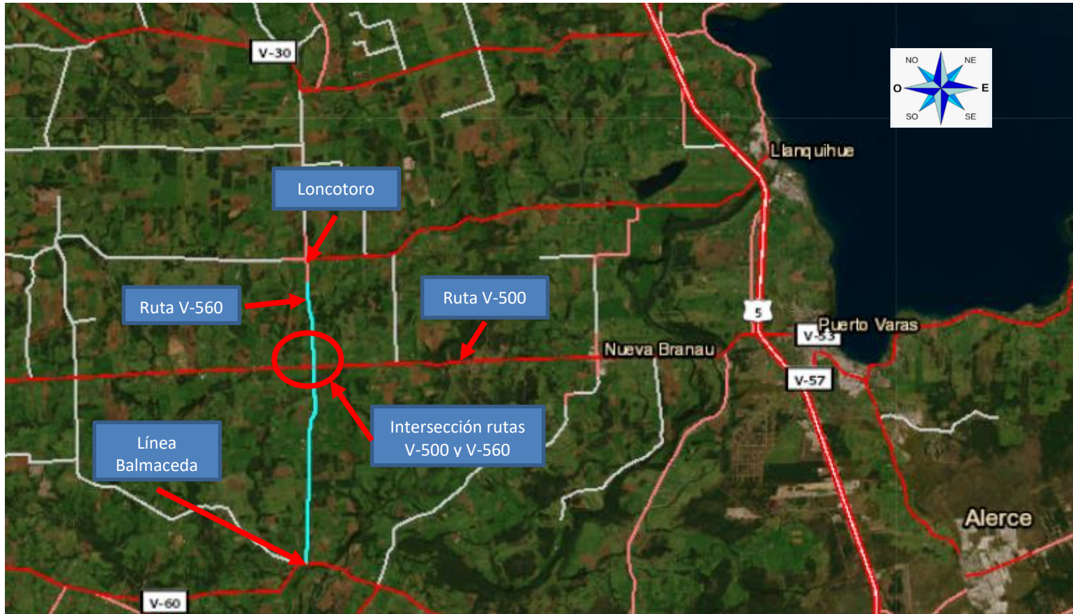
• Figura 1: Mapa de ubicación cruce entre rutas V-500 y V-560.

Elaborado por: Felipe Pineda Mora Jefe Provincial – Vialidad Llanquihue