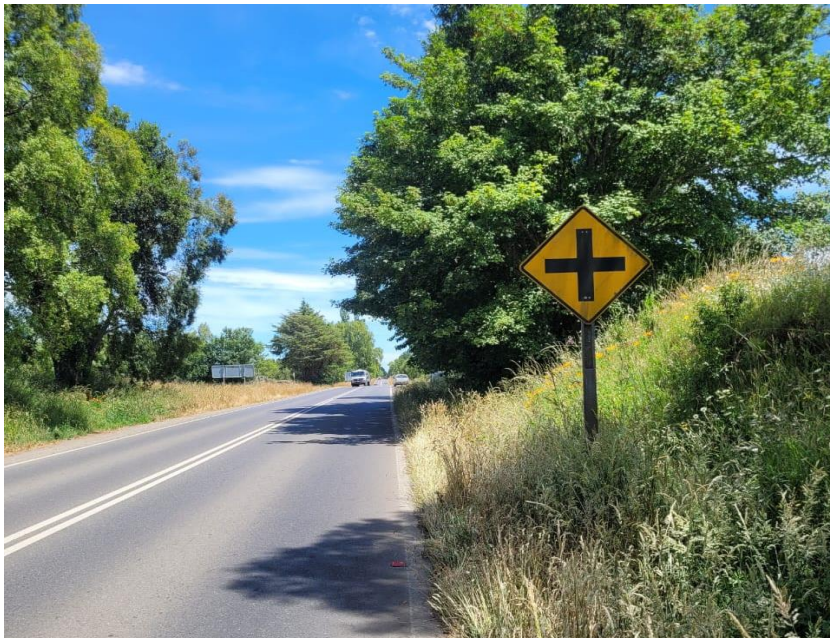
Figura 3: Señal vertical lateral de cruce en ruta V-500, dirección Pto. Varas – Río Frío