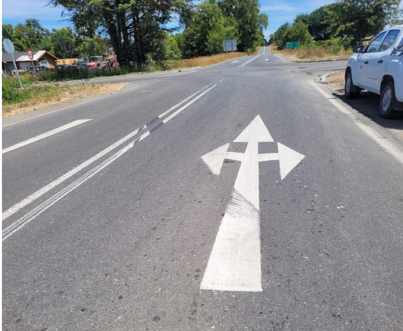
Figura 2: Demarcación de cruce en ruta V-500, dirección Pto. Varas – Río Frío.