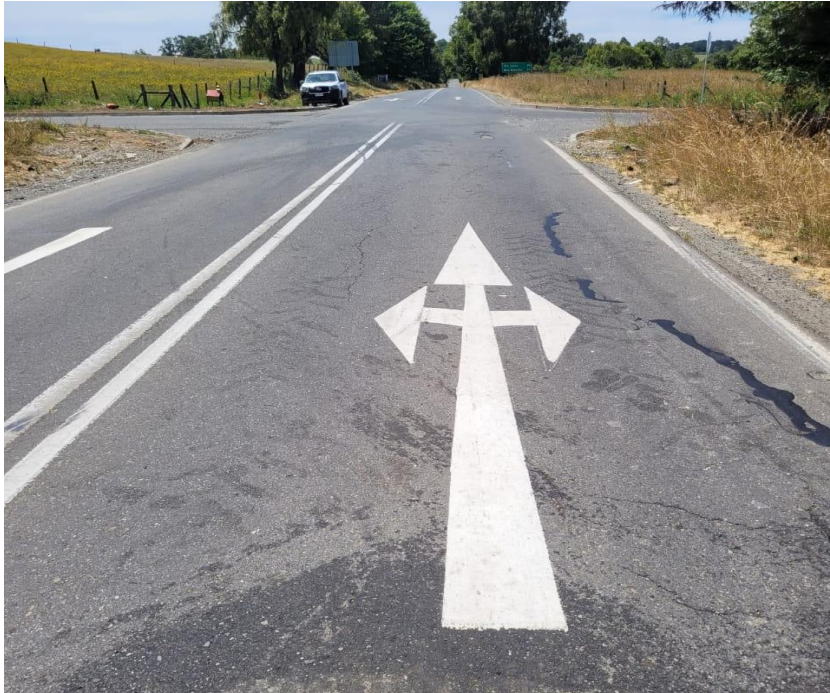
Figura 4: Demarcación de cruce en ruta V-500, dirección Río Frío – Pto. Varas.