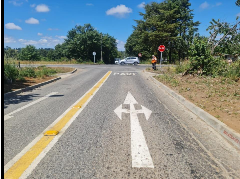
Figura 8: Símbolo de cruce, leyenda pare, señal de pare y mediana demarcada que incluye tachones, dirección Loncotoro – Línea Balmaceda.