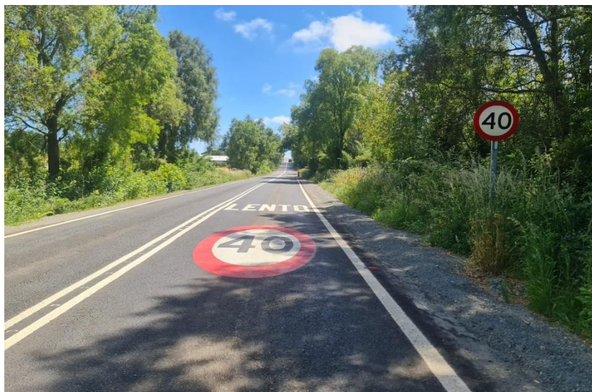
Figura 11: Leyenda lento en pavimento, preformado de velocidad, señal de velocidad, 200 m antes del cruce, dirección Línea Solar - Loncotoro.