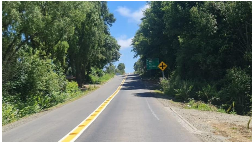
Figura 12: Señal de cruce, Señal de localidades y mediana demarcada que incluye tachones, dirección Línea Balmaceda – Loncotoro.