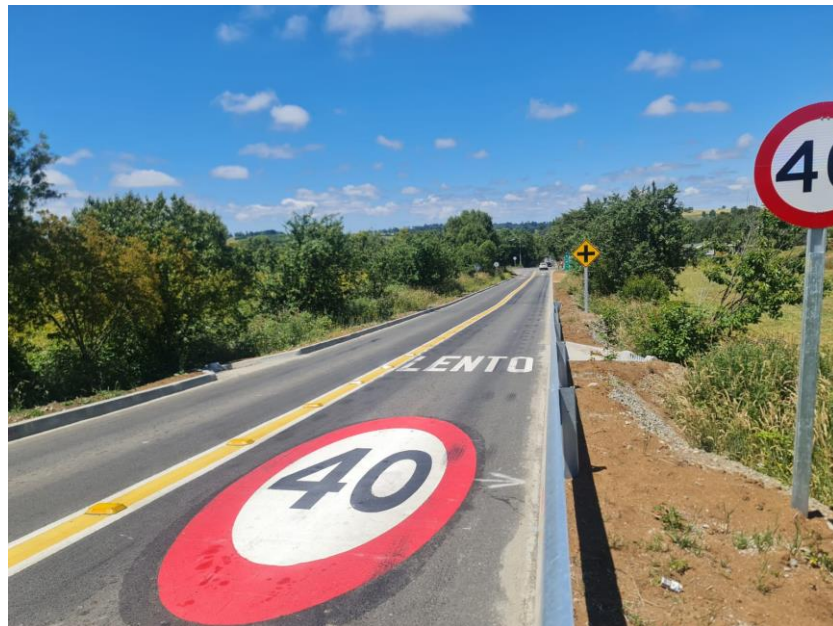
Figura 9: Señal de cruce, señal de velocidad, preformado de velocidad en calzada, leyenda lento y mediana demarcada que incluye tachones, dirección Loncotoro – Línea Balmaceda.