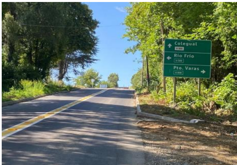
Figura 13: Señal de localidades, dirección Línea Balmaceda Loncotoro.