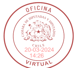
FIRMADO DIGITALMENTE: H.D. ALEXIS SEPÚLVEDA S.